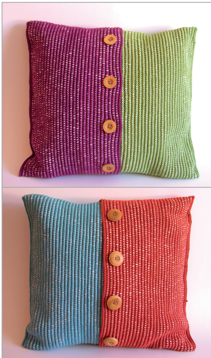
Cordón de algodón de 6 mm