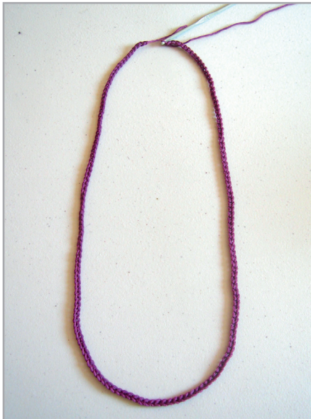
166 cad. que se cerrarán en redondo, no torcer la labor

Se teje en redondo. Con hilaza morada hacer 166 cad.