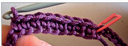
Vta. 1, inicio, colocar la marca color A en el 1 er p. de la vta. y seguir con mp.