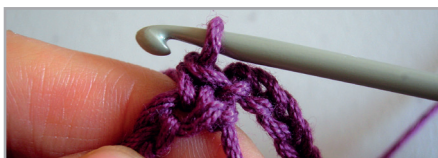
Vta. 1, inicio, 166 mp. empezando en la 1 er cad. para cerrar en círculo