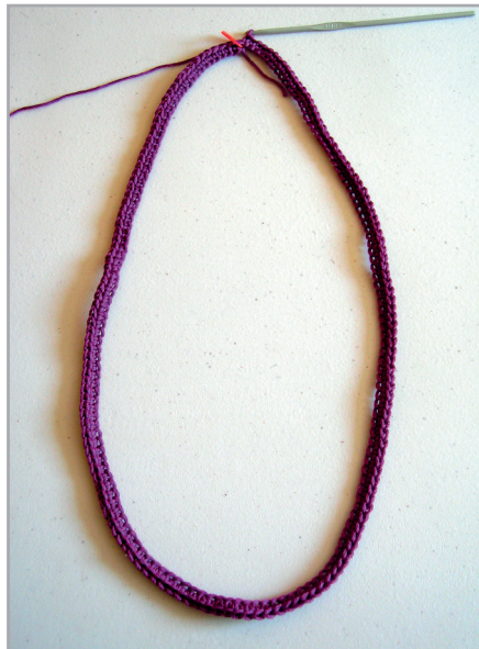
Vta. 1, final, 166 mp.

Vta. 2: A partir de esta vta. cargar el cordón de algodón. Sólo tomarlo dejando una hebra de 4 ó 5 cm, no hacer nudos. Hacer 166 mp.