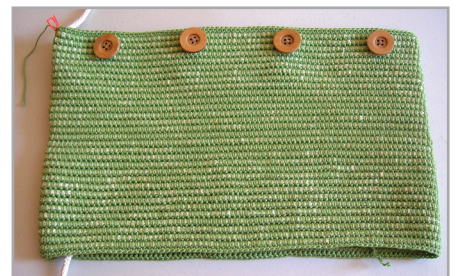
Vta. 32, final, media funda con botones

Vta. 32: Ya sin envolver el cordón de algodón hacer 166 mp. Hacer 1 pd. en el 1 er p. de esta vta. Cortar el cordón dejando una hebra de 4 ó 5 cm. No hacer nudos. Rematar. Coser los botones sobre los p. con las marcas color B.