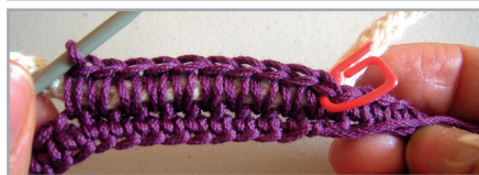
Vta. 2, inicio, envolver el cordón, reubicar la marca color A en el 1 er p. de esta vta.