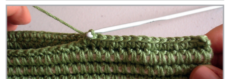
Cerrar orillas con mp.

Trabajar la otra del mismo modo, hacer en la media funda ladrillo los ojales y en la media funda azul colocar los botones.