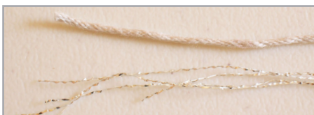
Hilaza de algodón gris e hilo plateado

Vta. 1 (HUESO/ ORO): 3 cad, 109 mac (cerrar el último mac. con GRIS y PLATA), 1 pd. en la 3 er cad= 110 p. Cortar HUESO/ ORO dejando una hebra de 4 cm.