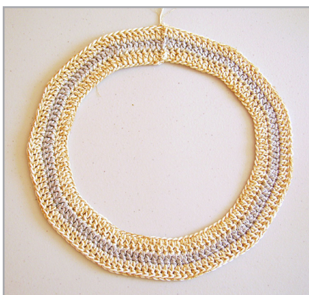
Vtas 1-3, tejido en redondo

Vta. 3 (HUESO/ ORO): 3 cad, 9 mac, 2 mac. en el sig. p, (10 mac, 2 mac. en el sig. p) rep. ( ) 10 veces= 132 p. Rematar.