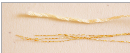
Hilaza de algodón hueso e hilo dorado

Se trabajan en redondo las vtas. 1-3, después se trabaja en vtas. cortas por el frente de la labor. Con HUESO y ORO hacer 110 cad y cerrar en redondo con 1 pd. en la 1 er cad. No torcer la labor.